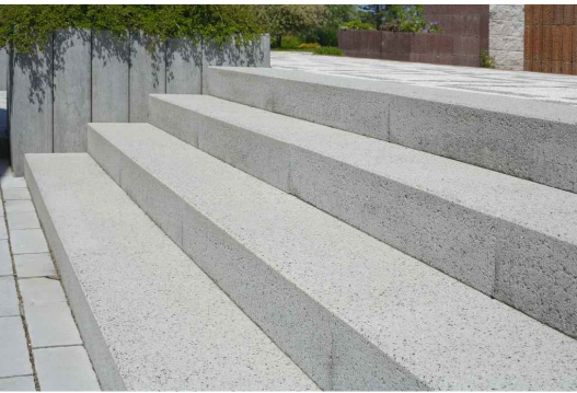
S2 - prefabrikované betonové schodišové stupně hladké, 1000x400x150mm