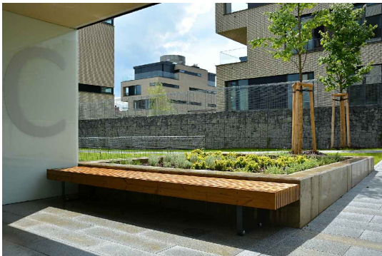
L2 - lavička konzolová na zídku, 2900x530x420 mm, borovice TW