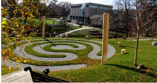
H1 - přírodní labyrint, betonové kostky/štěrk, tráva, průměr 5m