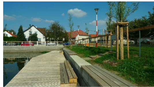
M1 - molo z odolného dřeva (dub), s nástupním schodem, vyrovnávající výškový rozdíl, plováky z ocelových znikovaných ráků s celoobjemovou výplní, svislé kotvení přes dalby či ramenové uchycení, 3x8 m, atypický rozměr v SZ rohu rybníka, cca 3x3 m