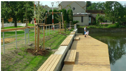
M2 - dřevěné sedáky z odolného dřeva (dub), umístěné na sanovaný betonový okraj rybníka, 1000x500x40 mm