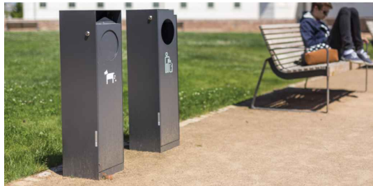
C1 - Celoocelovy uzavřeny odpadkový koš, 32 l, bez víka do vřazovacího prostoru, 260260X985 mm