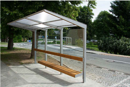
Z1 - modulární přístřešek k zastávkám MHD, 2820x1846x2567 mm, bez bočnic, skleněná záda, skleněná/polykarbonátová střeška, sedák z borovice TW