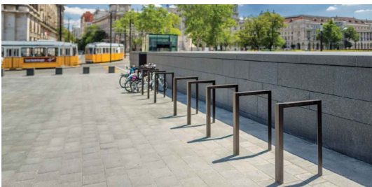
S1 - Jednoduchý stojan na kola, 600x60X1005 mm, Zinkovaná ocelová konstrukce, otvení pod dlažbu se skrytými šrouby