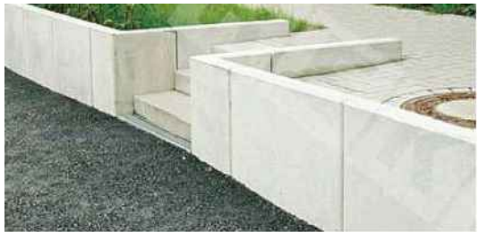
O1 - zídkový prefabrikát hladký, v=max 600 x 80 mm