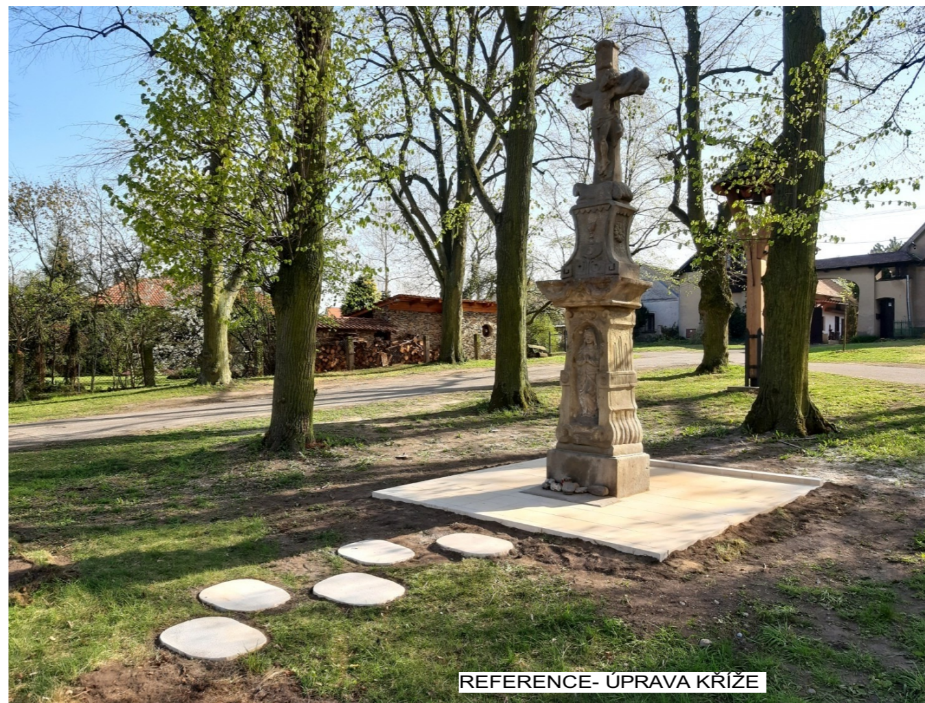
REFERENCE- ÚPRAVA KŘÍŽE

zodpovědný projektant Ing. arch. Tomáš Havelka autorizovaný architekt autorizace A1 č. 05135 V. Dobiáše 498 506 01 Jičín tel: 603 445 750 havelka.architekt@seznam.cz www.havelka-architekt.cz