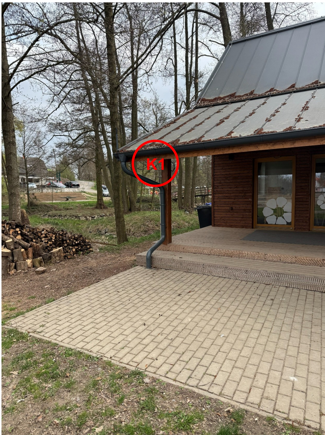
RB - K1