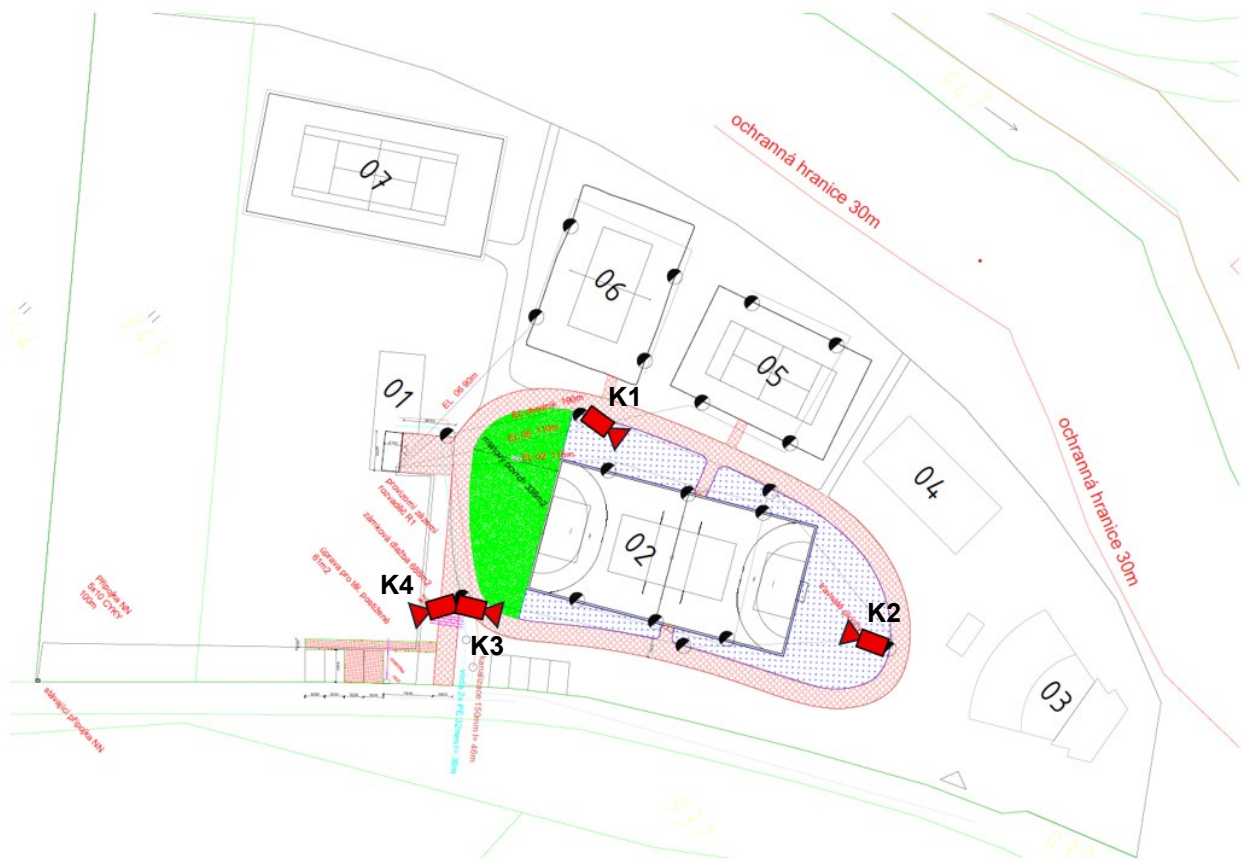
Rozmístění kamer objekt sportovního areálu (SA).