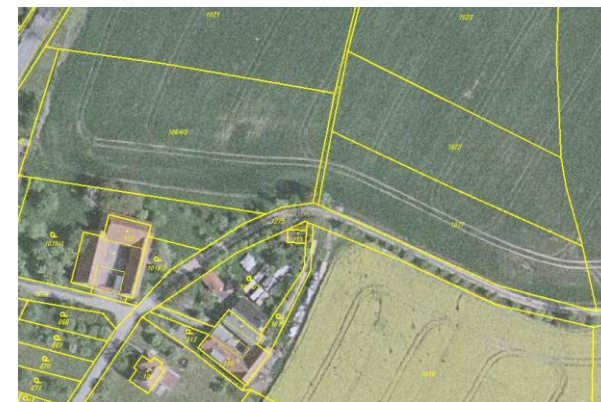
Ortofoto s obrazem katastrální mapy po obnově katastrálního operátu

Po skončení prací na obnově katastrálního operátu dochází k vyhlášení jeho platnosti. Podle § 58 odst. 2 vyhlášky č. 357/2013 Sb., katastrální vyhláška, zašle katastrální úřad sdělení o vyhlášení platnosti obnoveného katastrálního operátu obci, na jejímž území byl katastrální operát obnoven. Obec zveřejní tuto informaci v místě obvyklým způsobem. Katastrální úřad a Český úřad zeměměřický a katastrální zveřejní vyhlášení platnosti obnoveného katastrálního operátu rovněž na svých internetových stránkách.